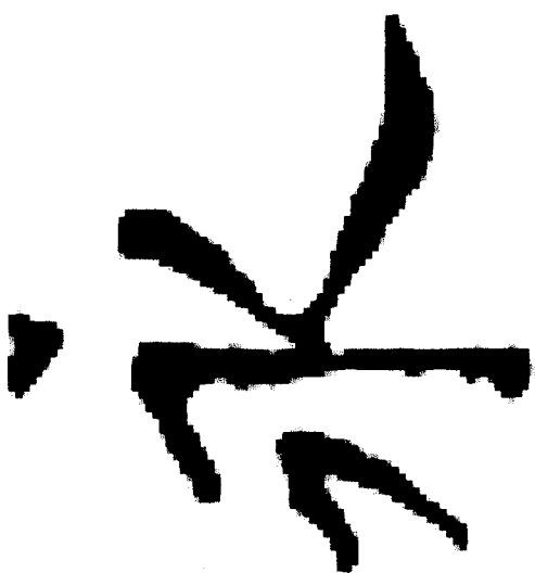
唐 歐陽詢 皇書誕碑