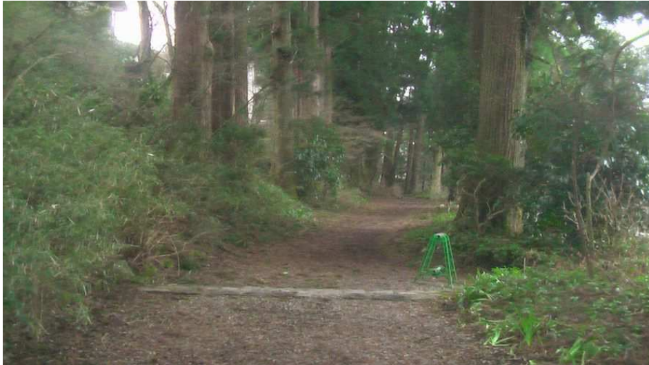
(写真 箱根杉並木 雪で落ちた杉 杉並木の下で待ってる若妻 (葉) )