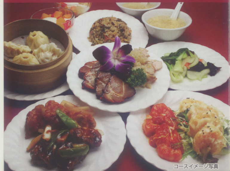
コースイメージ写真